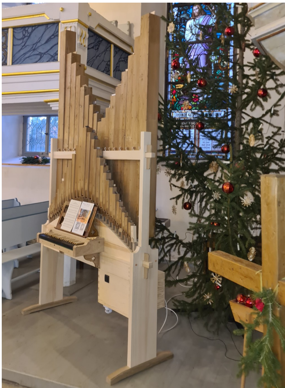
Die Schmetterlingsorgel bei der Einweihung am 11.01.2025

info@orgelbau-hoffmann.de www.orgelbau-hoffmann.de