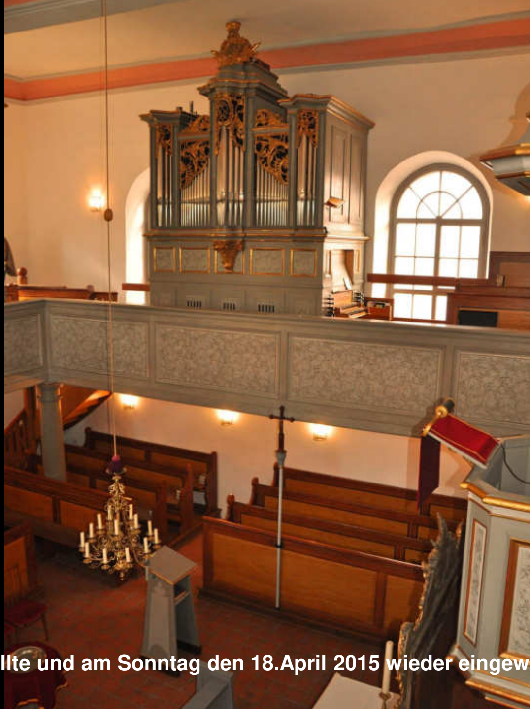
Das fertig gestellte und am Sonntag den 18.April 2015 wieder eingeweihte Instrument